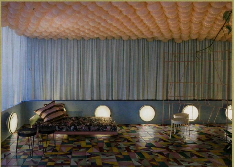
Corrispondenza de Dimore Studio, Ceramica Bardelli.